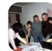
Formateurs et assistants